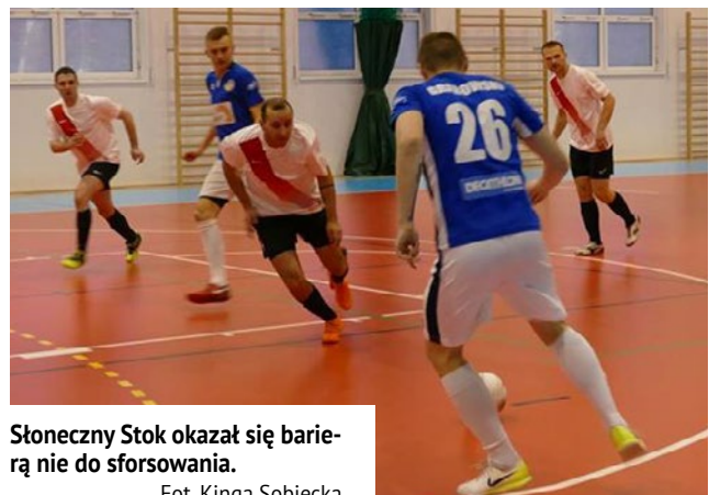
Słoneczny Stok okazał się barierą nie do sforsowania.

Mimo, że od początku spotkania przewagę zdobyli goście, to nie była ona zbyt wysoka. Przy wyniku 0:1, 1:2, 2:3 kibice zgromadzeni w hali widowiskowo-sportowej w Korszach mieli nadzieję, że to może wyżej notowani goście odjadą „z kwitkiem”. Niestety, w drugiej części gry do głosu coraz wyraźniej dochodzili