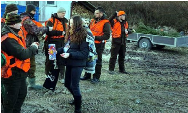
Zbiórka w gminie Korsze rozpoczęła się na polowaniu.