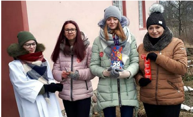
Uczniowie z Łankiejm przystąpili do WOSP po raz pierwszy.