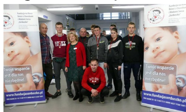
Uczestnicy i organizatorzy turnieju.

6 stycznia w hali widowiskowo-sportowej w Korszach odbyło się niezwykle wydarzenie. Po raz pierwszy w historii obiektu zorganizowano piłkarski turniej charytatywny.