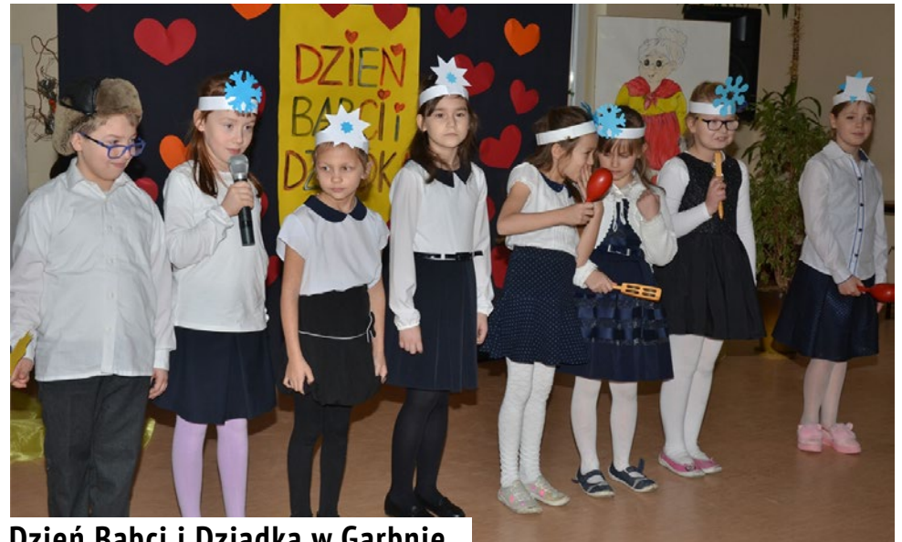
Dzień Babci i Dziadka w Garbnie

Po raz pierwszy do udziału w WOSP przystąpili uczniowie ze Szkoły Podstawowej w Łankiejmach. Przedstawiciele szkolnej rady wolontariatu, działającej przy samorządzie uczniowskim, uzbierali 836, 72 złotych. red