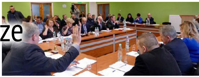
Radni opozycyjni wstrzymali się od głosu w sprawach finansowych.

- Dalej będziemy realizowali to, co do tej pory, ale jeszcze intensywniej i jeszcze lepiej – dodaje burmistrz Korsz.