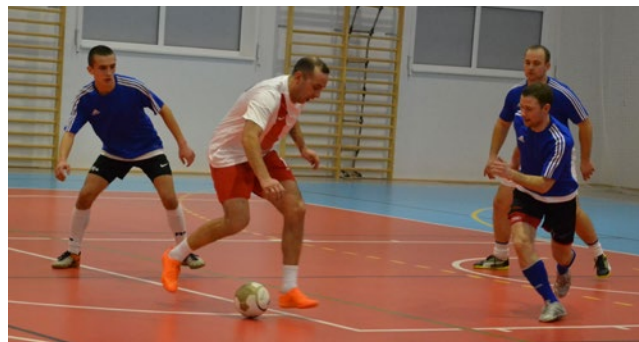
Drużyny Goalsize (białe koszulki) i Wybrzeża Klatki Schodowej, czyli finaliści Pucharu Tygodnika Kętrzyńskiego, mogą także zmierzyć się w finale Korszeńskiej Ligi Halowej.

Zawodnicy Burzy pokonali w pierwszym spotkaniu ekipę Ananasy, jednak w drugim meczu, po serii rzutów karnych, musieli już uznać wyższość przeciwników. Konieczny był więc trzeci mecz, w którym znów lepsza okazała się Burza. Podobnie było w starciach WKS z KJ Auto. Pierwsze, po skutecznie wykonywanych rzutach karnych, przechylili na swoją