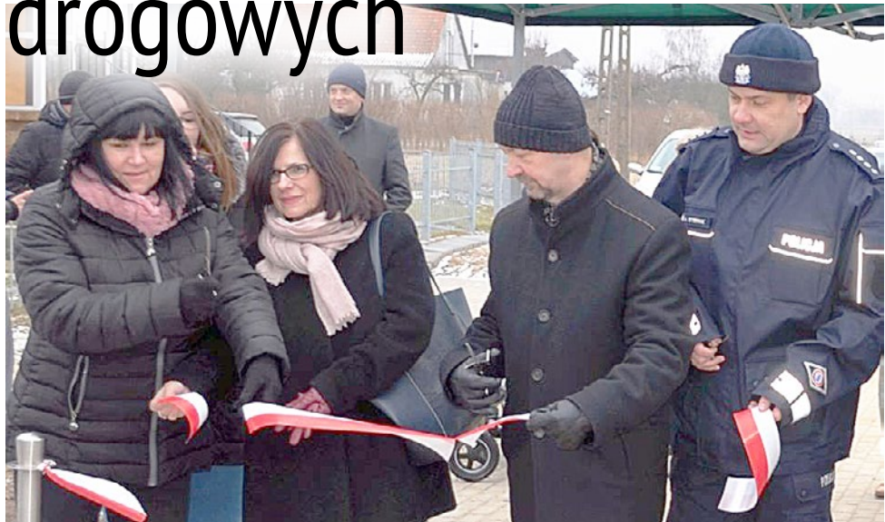
W ostatnich dniach uroczysto otwarto m.in. wyremontowaną ulicę Wiejską w Korszach.