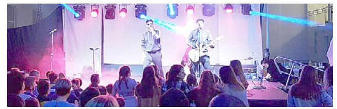
Zespół Łobuzy – gwiazda niedzielного koncertu w Korszach.