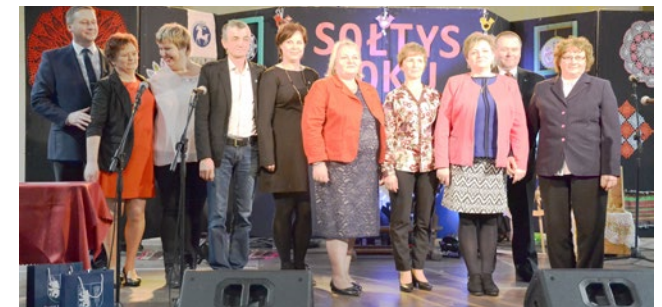
Sołtysi wyróżnieni w powiatowym plebiscyście.

Wszystko zaczęło się 9 marca. Wówczas sołtysi z gminy Korsze wraz z burmistrzem Ryszardem Ostrowskim, wzięli udział w Samorządowym Dniu Sołtysa, zorganizowanym przez samorząd województwa warmińsko-mazurskiego. Uroczystości odbyły się w Ostródzie, w Centrum Kongresowo-Konferencyjnym Expo Mazury, gdzie przybyło ponad tysiąc sołtysów z całego