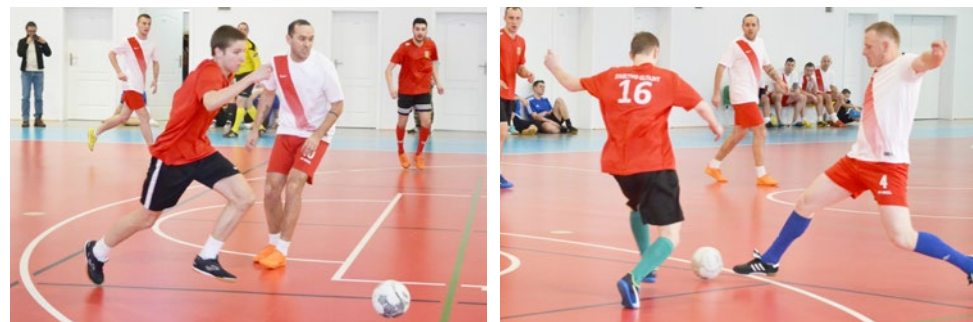
Radość zawodników Burzy Glitajny po ostatnim gwizdku w spotkaniu finałowym.