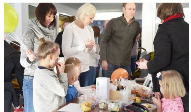
Koncert cieszył się dużym zainteresowaniem nie tylko mieszkańców Korsze.