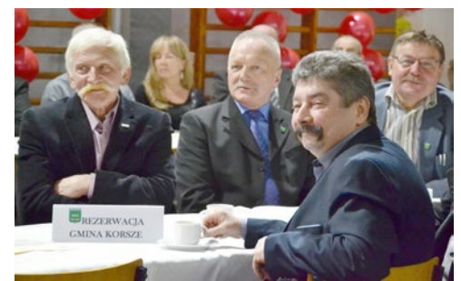
Delegacja gminy Korsze podczas powiatowej gali Sołtys Roku 2018.