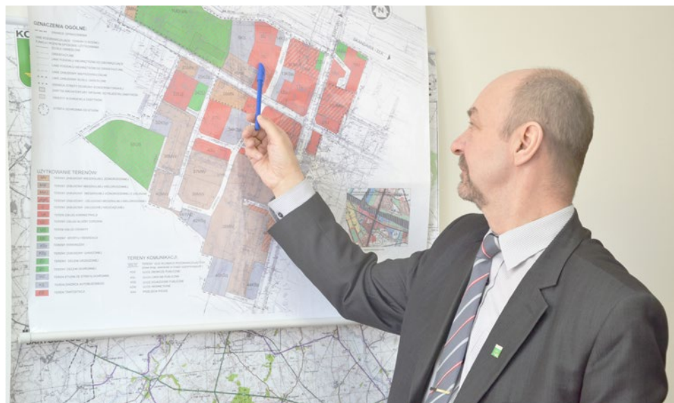
Burmistrz Korsze: - Stan dróg gruntowych po zimie jest w tym roku wyjątkowo fatalny.